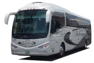
DIAGRAMA DE ASIENTOS IRIZAR i6 51 PLAZAS 2 PUERTAS